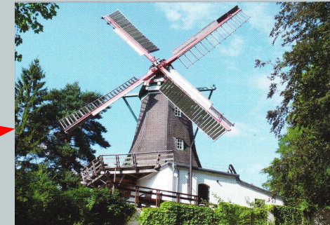
Bergedorfer Mühle Chrysanderstr. 52 A 21029 Hamburg