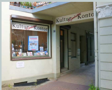
Kultur- & Geschichtskontor Reetwerder 17 21029 Hamburg