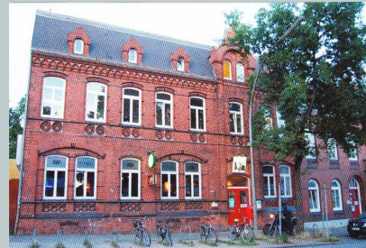
Kulturzentrum LOLA Lohbrügger Landstraße 8 21031 Hamburg