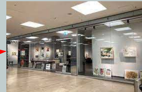
Offenes Atelier Bergedorf im CCB Weidenbaumsweg 21 21029 Hamburg Sonntags geschlossen