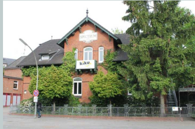
KIKU Kinderkulturhaus Lohbrügger Markt 5 21031 Hamburg